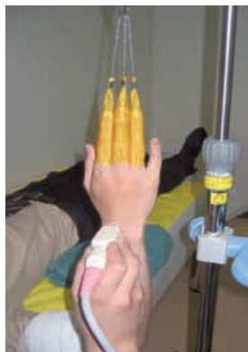
特殊な装置を用いた整復

本院では、現在、特殊な牽引装置を用いた整復、あるいは機械などを使わずに手で行う整復(徒手整復)の時に、骨折部の状態を超音波検査にて確認し、ギプス固定を行っています。