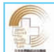
平成16年 病院機能評価認定取得