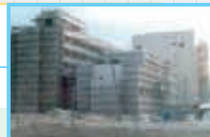
昭和52年 建築工事中