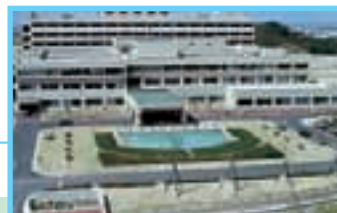
昭和54年 完成4ヶ月後の玄関