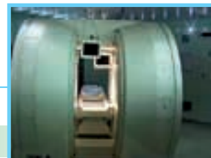
平成12年 I V M R 装置