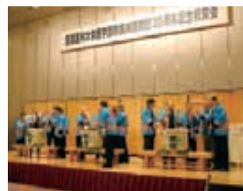
開院30周年記念事業（記念式典・記念講演・祝賀会）の様子