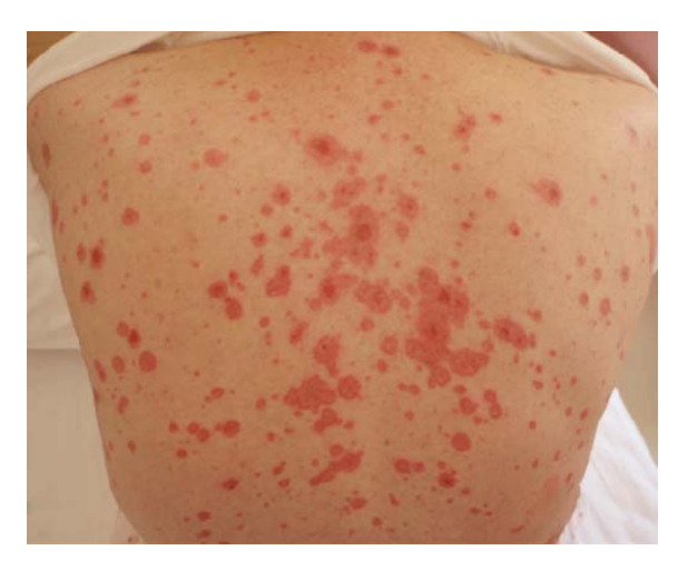
図 3:. 背部の滲出性紅班 紅斑の中心は陥凹して特徴的な標的状の外観を呈している。一部の皮疹は拡大し癒合している。

病理検査:皮膚科にて皮膚の迅速病理診断が行われた。表皮角化細胞の融合性壊死像と表皮真皮境界の液状変化を認め(図 4)、重症型滲出性紅班と診断された。