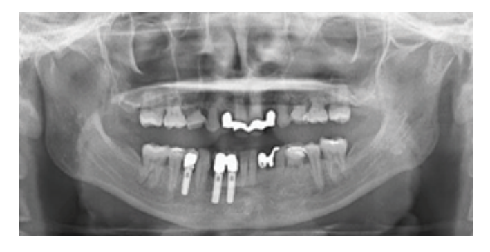
写真 8 最終補綴物の装着から 2 年 3 か月後のパノラ マ X 線写真(平成 22 年 4 月初旬)