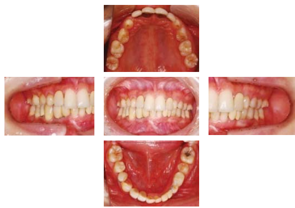
写真7 最終補綴物装着後の口腔内写真 (平成20年1月初旬)