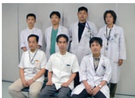
脳神経外科スタッフ