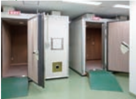
脳波検査ユニット