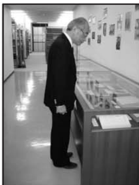
馬場学長も展示をご覧になりました