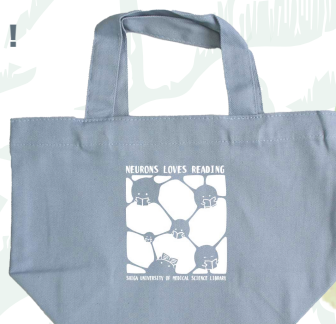
オリジナルミニトート

レビュー投稿は何回でも可能ですが、プレゼントはおひとり1つまでです。 （予定数が配布次第終了）