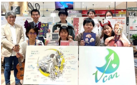
2023年10月9日開催 第1弾の様子

主催 ：滋賀医科大学 国際保健・地域医療研究会「TukTuk」、若者に HPV ワクチンについて広く発信する会「Vcan」