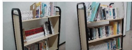
新規購入したSTEAM教育関係図書