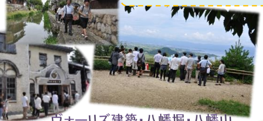
ヴォーリス建築・八幡堀・八幡山

沖島や近江八幡の散策で知らない場所に沢山行きました。「こんないいところがあるのか」と五感で感じる事ができました。(医学科 1年)