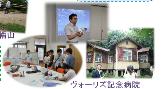
ヴォーリス記念病院

ホスピスに限らず患者さんとの心を通わせることの大切さはどの医療現場でも同じことだと思います。私は患者さん一人一人の思いを大切に、患者さんを手放さずサポートしていけるような医師を目指したいと思います。 (医学科 2年)