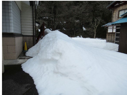
< 中河内診療所 >