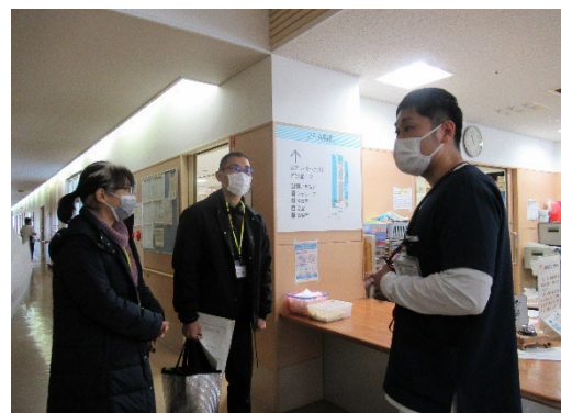
< 湖北病院 >