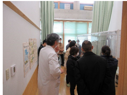
< 中之郷診療所 >